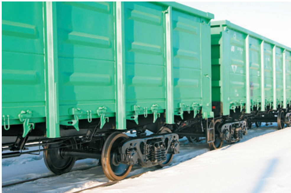
На снимке: первые вагоны 2012 года готовы к отправке.

➔ Первые два месяца 2012 года стали сложным периодом в жизни завода. Мы понимаем, что вынужденные простои и связанное с ними снижение доходов коллектива тяжело отражаются на жизни сотрудников. Это очень трудная и болезненная, но, к сожалению, необходимая для предприятия мера. Это лишь малая часть работы по максимальному сокращению издержек — затраты сокращены по всем направлениям. Недаром говорят: «под доходы и расходы». Без подобных действий невозможно преодолеть сложности, связанные со сменой собственника: нужно время, чтобы изменить структуру управления, обеспечить поставку ключевых комплектующих, заключить новые контракты с покупателями.