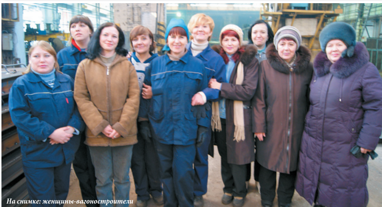
На снимке: женщины-вагоностроители

Активное участие в создании новых вагонов модели 12-9780 принимают женщины — сотрудницы вагоностроительного цеха. У них разные профессии — машинисты кранов, кладовщик с ведением табельного учета, распределители работ, уборщицы производственных помещений. И хотя дамы единодушны в том, что самая тяжелая работа — с металлом — все-таки прерогатива мужчин, женщины в цехе работают с максимальной отдачей, отлично справляясь с порученным заданием.